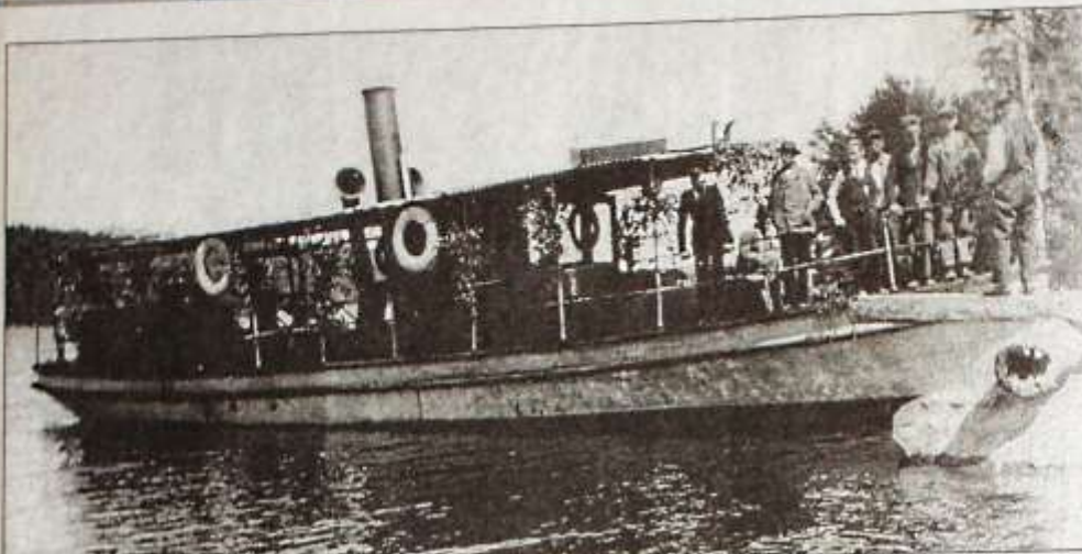
Yxningen i gick på sjön Yxningen mellan 1908 och 1941. Till vardags drog hon timmer, men hon kläddes också i björkris och användes till fest.