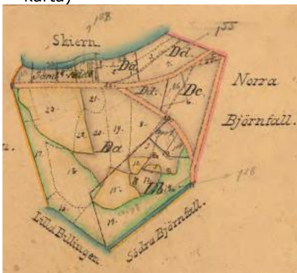
Karta ovan: från delning 1896 Karta t.v. Frömans tomtkarta från 1897. Från Bo Hagefalk

På kartan t.h. visas den tomtuppdelning som gjordes 1897 (Frömans karta)