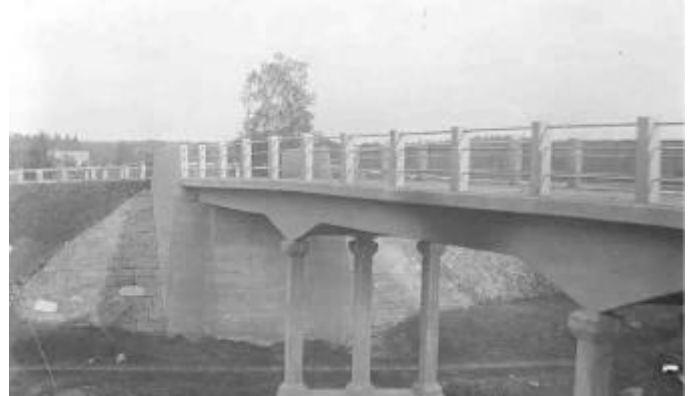
Den gamla järnvägsbron