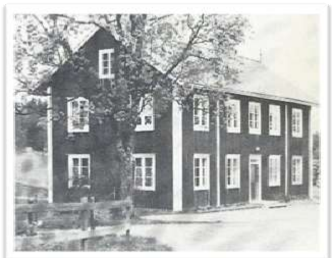
Sockenhuset med småskola

Småskolan i Fredriksberg flyttades till Sockenhuset 1889, och tillbaka till Fredrikberg 1957.