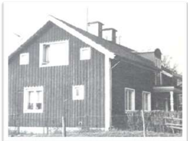
Dagsbergs första skolhus

1888 uppfördes Sockenhuset av överblivet virke från kyrkbygget. Det var ett kombinerat småskole-sockenhus och församlingshem.